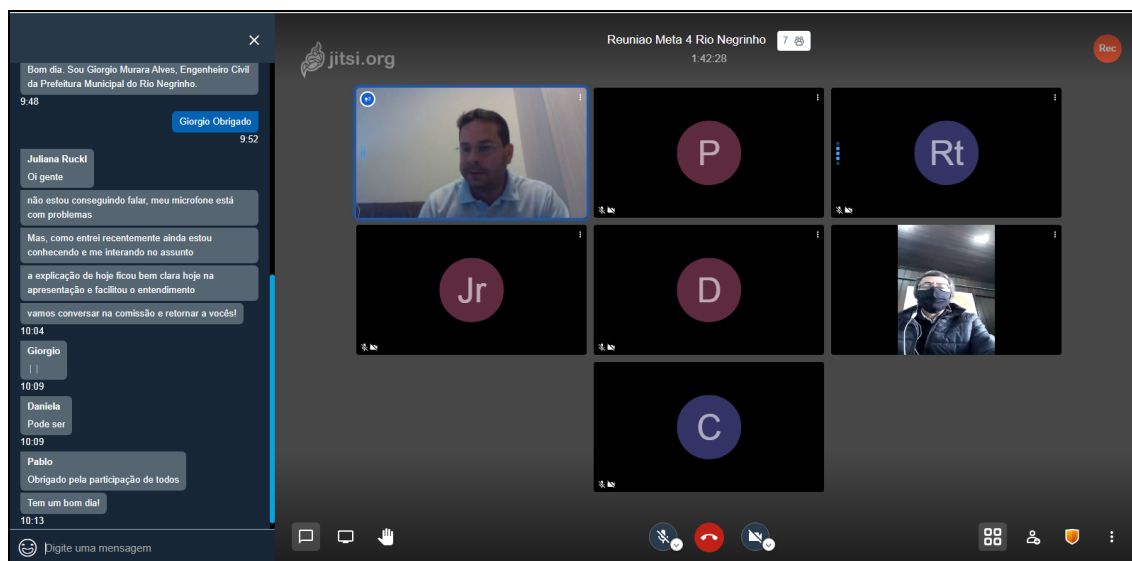
Figura 3 – Discussão entre os participantes durante a oficina

A estruturação, organização, condução, logística e funcionamento da Oficina Virtual (Videoconferência) foi de comum acordo entre a Consultora e o Comitê Diretor Local. A lista de presença e a ata do evento podem ser visualizadas, respectivamente, no Anexo 2 e no Anexo 3.